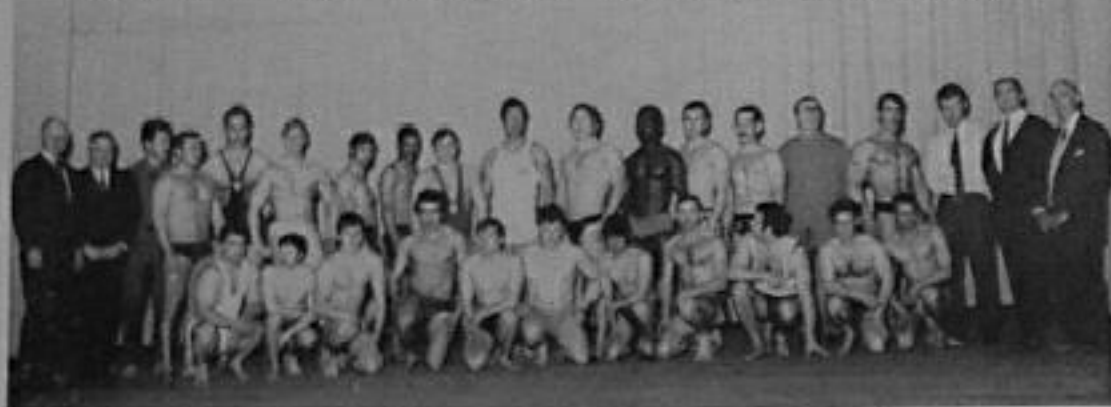
Groupe des concurrents, encadrés par leurs présidents respectifs

France - Belgique - Luxembourg à Denain, le 13 avril 1969