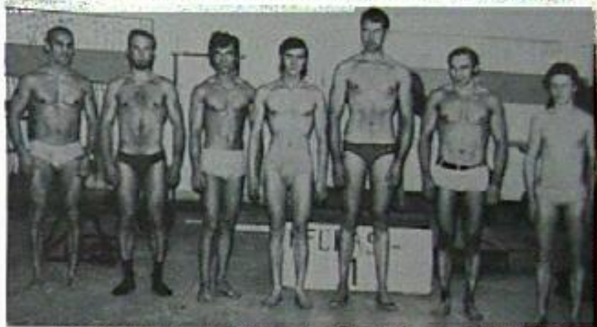
Les concurrents du Critérium des Espoirs, devant leurs juges

Dès 9 heures, le matin, les concurrents du Critérium des Espoirs affrontèrent leurs premiers juges et furent présentés au public le soir après le triathlon.