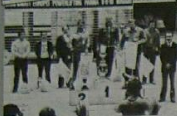
L'Equipe de Grande-Bretagne championne d'Europe

CHAMPIONNAT EUROPEI POWERLIFTING PARMA 8-9-10 MARSU